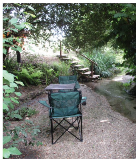
Fig. 5. A descoberta de novos caminhos. Pontes para outros lugares. Estar no Rio.