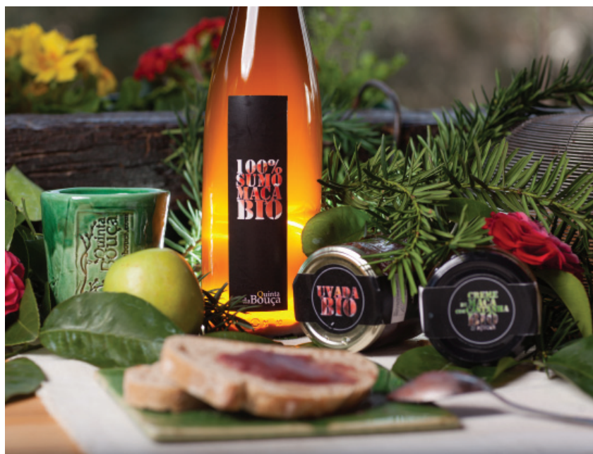
Fig. 7. A quinta, bem perto, com experiências únicas. Animais, Agricultura, Sumo de Maçã Bio.