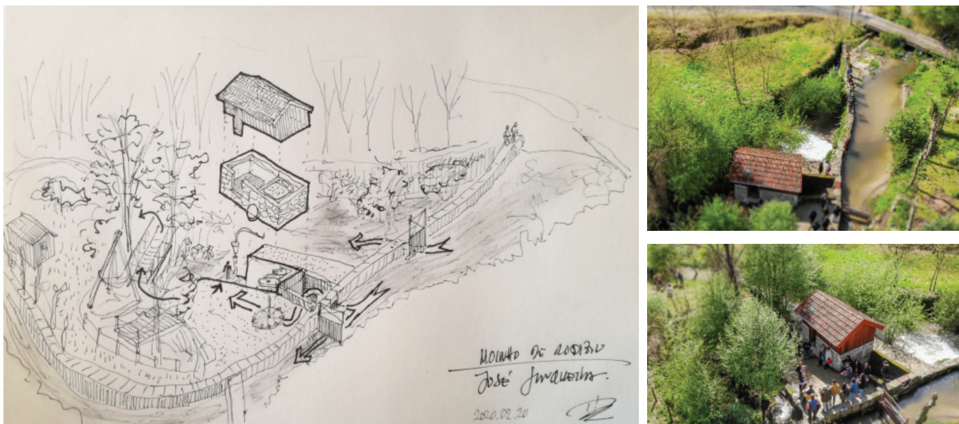
Fig. 2. Desenho Geral (por Arq. Hugo Nascimento) e Integração com envolvente