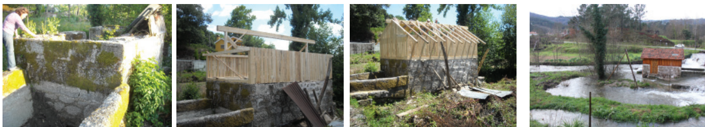
Fig. 1. Um pouco do passado, desde a descoberta, à reabilitação e a imponência do Rio Bouro (Rio de Veade)

During the last few years, several have come to stay and relax at this place. Though we are not far from the street, it is possible to hear the birds singing and the breeze flowing through the leaves. You can walk along the river or swim near the dam. Visit our farm house (a 5 minute walk away) which has all modern conveniences.