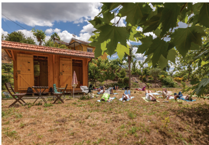
Fig. 6. A planície de com zona de apoio, espaço livre para acampar ou actividades como Yoga.