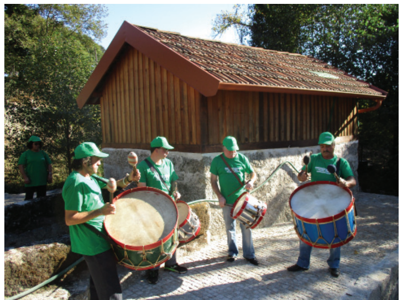
Fig. 4. Actividades no Moinho. Bombos (grupo local), e animação aquática no Açude durante o Verão.